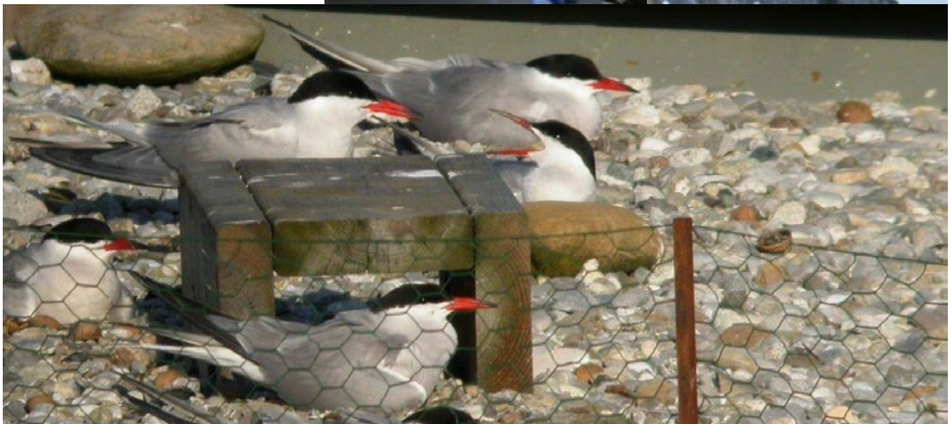
Sternes pierregarin sur un radeau nicheoir et baguage de Balbuzard pêcheur