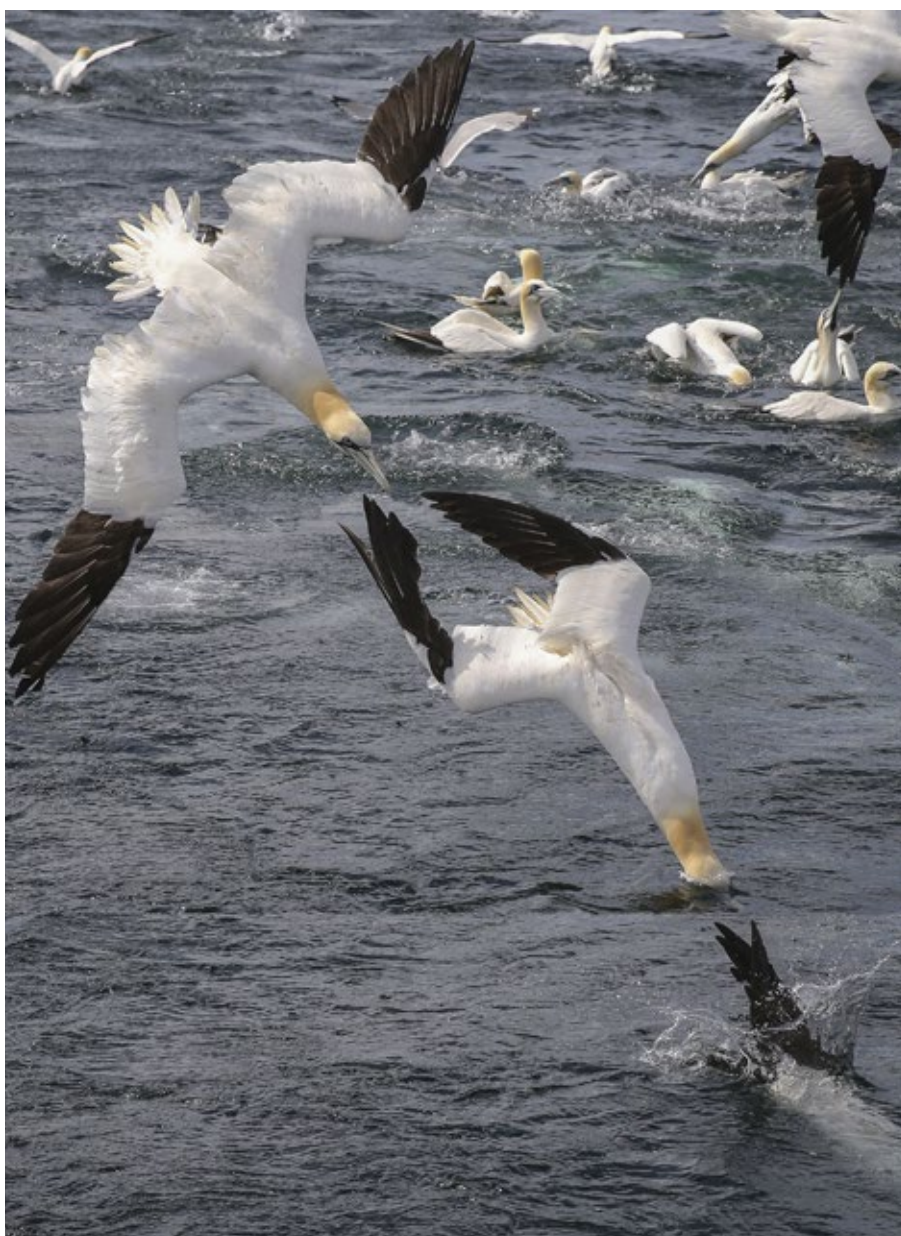
Fous de Bassan

Les passereaux qui franchissent la Méditerranée durant la nuit pour gagner le continent européen font souvent une escale sur des îles proches de la côte, avant de poursuivre leur périple. Grâce à des observations détaillées sur des fauvelles des jardins venant d'arriver sur une île-étape, les chercheurs ont décou-