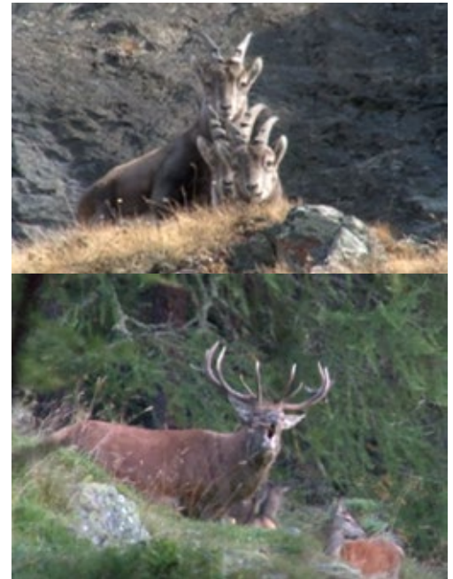
Des images extraites de Rêves sauvages