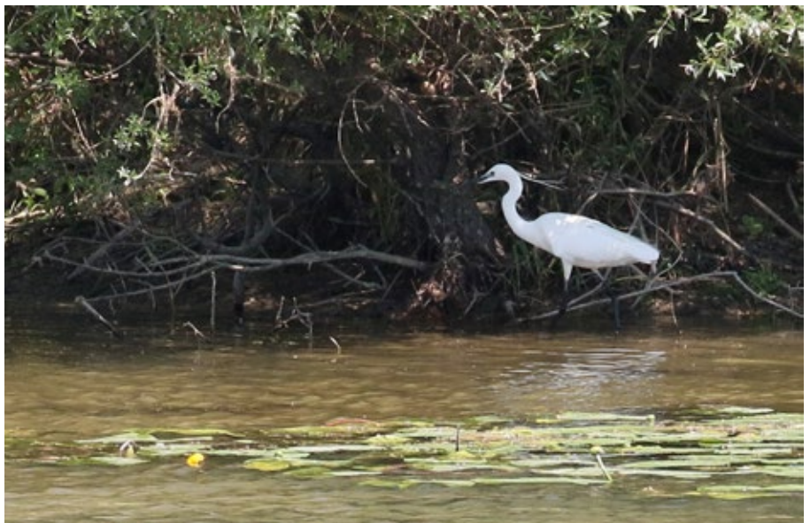
Bec et pattes noirs, il s'agit bien de l'Aigrette garzette