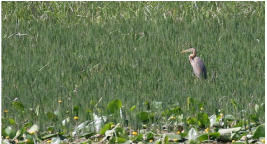
Un Héron pourpré dans son habitat préféré: la roselière