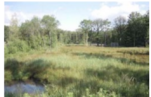
Site des Douves en 2013, 4 ans après les travaux d'aménagements