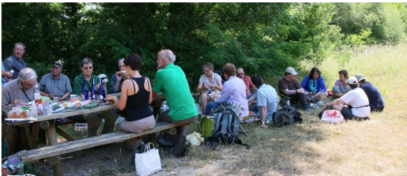
Un sympathique pique-nique à l'ombre qui tombe à pic pour picorer et se reposer