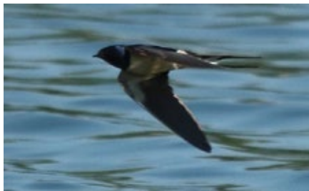
Une Hirondelle chassant au raz de l'eau