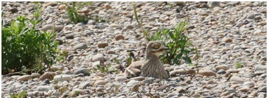
Grâce à son plumage, l'Oedicnème est magnifiquement camouflé sur une plage de galets