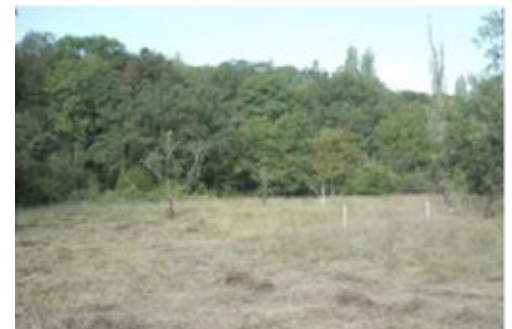
Fauche sectorisée pour maintenir les biotopes des prairies bordant l'Allondon

La conférence du mois au Muséum d'histoire naturelle