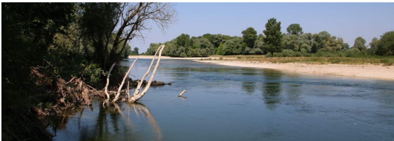
Le Doubs présente des caractéristiques très naturelles et favorables à de nombreuses espèces