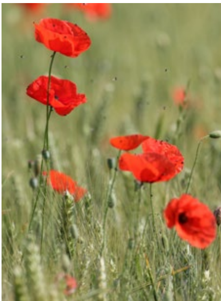
Fragilité, légèreté et élégance: le coquelicot