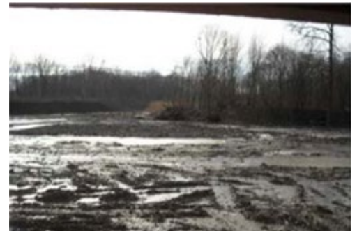
Site des Douves à la fin des travaux d'aménagement en 2009

Cette conférence est commune à la Société Zoologique de Genève et à la Société des Amis du Jardin botanique.