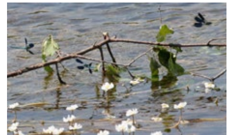
Les caloptéryx virevoltent de partout