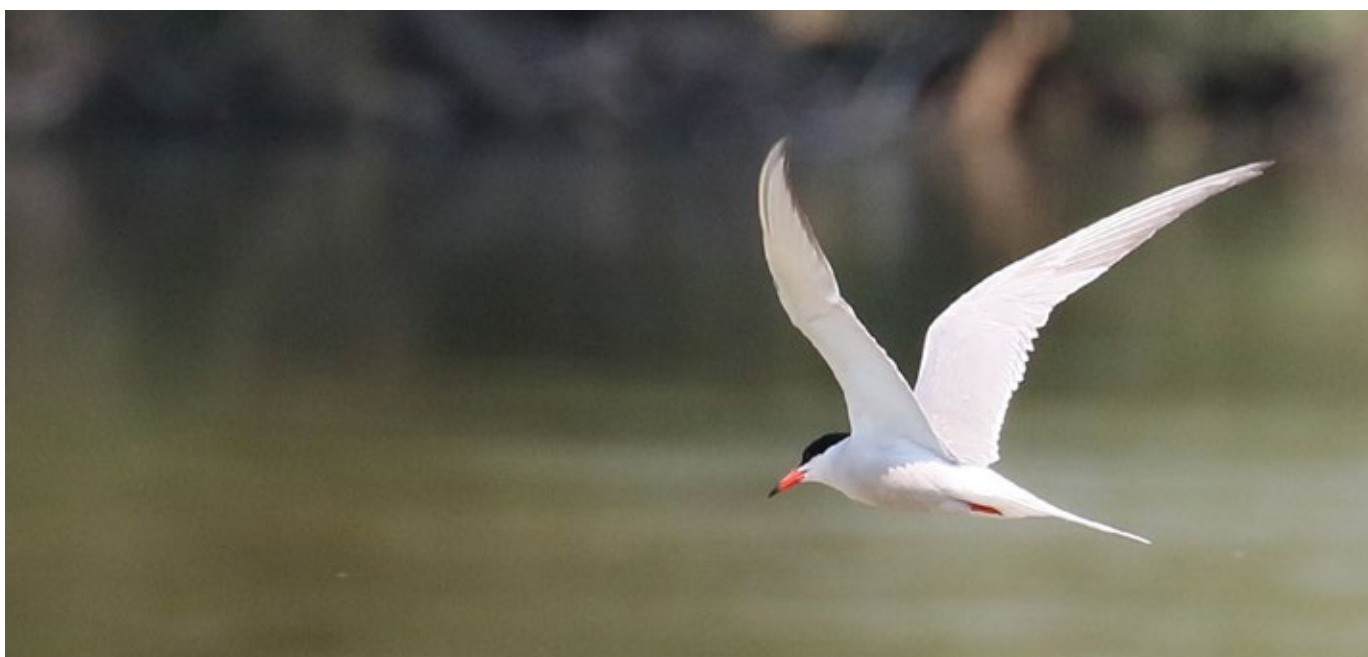
La Sterne pierregarin, facile à reconnaître grâce à sa tête coiffée de noir et son bec rouge se terminant par une tache noire