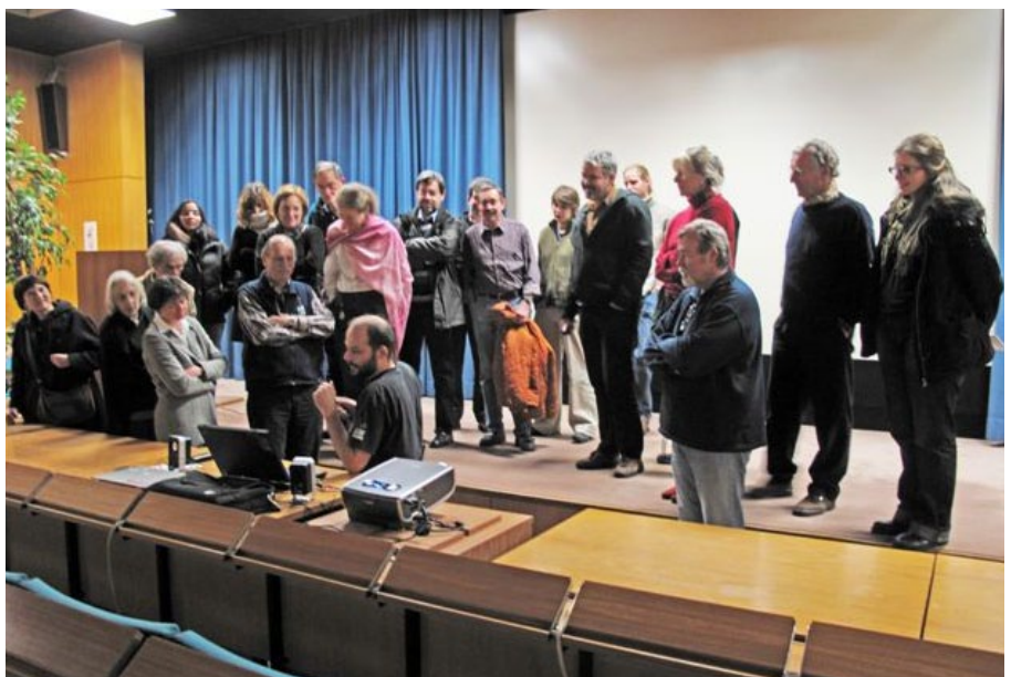
Une installation inhabituelle lors de la dernière conférence.