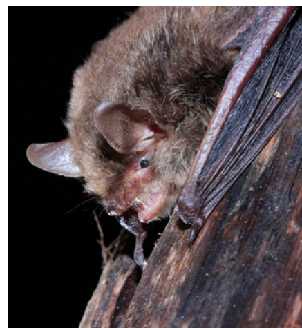
Le Murin d'Alcathoe ( Myotis alcathoe ) : première capture de cette espèce rarissime en Suisse et nouvelle pour Genève! Vallon de la Roulavaz, 17 mai 2009

tion Nicolas Hulot pour la Nature et l'Homme) et le second prix «Nature et Découvertes» avec le soutien de la Fédération des clubs CPN (décerné par les magasins Nature et Découvertes, la Fédération des clubs CPN, récompensant le meilleur film à vocation pédagogique). Site du programme LIFE: http://www.sfepm.org/LifeChiropteres/Accueil.htm