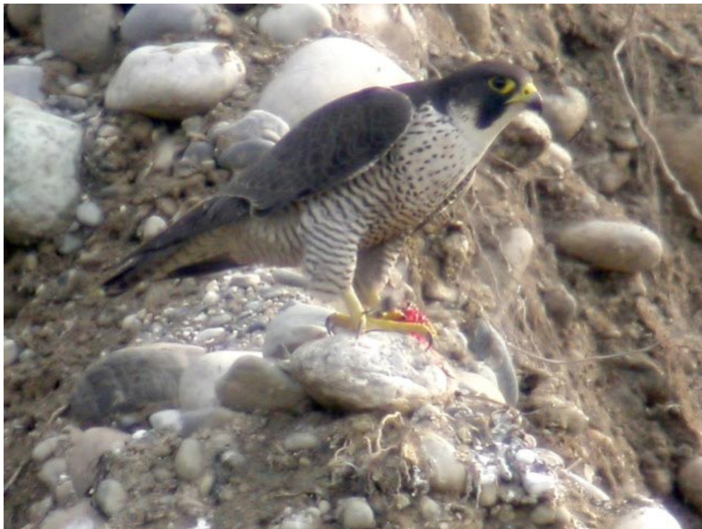
Faucon pèlerin, Verbois, 2005, photo Samy Mayor

Pour plus d'informations, ou pour recevoir le programme et la newsletter par e-mail: www.grandeurnature.ch ou barbara.fetz@grandeurnature.ch , tél: +41 22 343 31 16 ou +41 79 509 54 31.