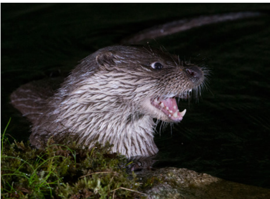
La Loutre est piscivore, elle a besoin d'une dentition adaptée, photographie par Michel Jaussi

Pour plus d'informations au sujet du Parc naturel régional des Millevaches, voir: http://www.pnr-millevaches.fr