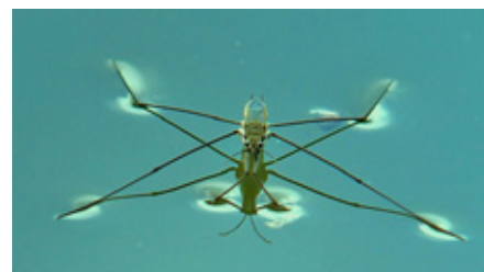
A ne pas confondre avec une Loutre ... ceci est bien un Geris, une des nombreuses espèces de punaise aquatiques.

silencieux et attentif, aux bruits, aux ronds dans l'eau, créés par les poissons, les Geris ou... la Loutre. Finalement, vers 4h du matin, je pense en avoir revu une traverser l'étang, mais, avec la fatigue, c'est peut-être juste parce ce que j'avais très envie d'en revoir !