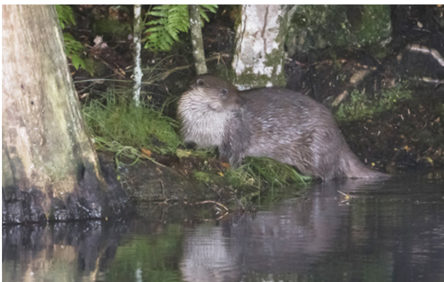
Une Loutre dans le Pnr des Millevaches