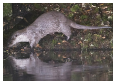
Ce soir-là, la Loutre est cabotine.

A 6h30, ravis de ces observations, nous n'étions pas fatigués.